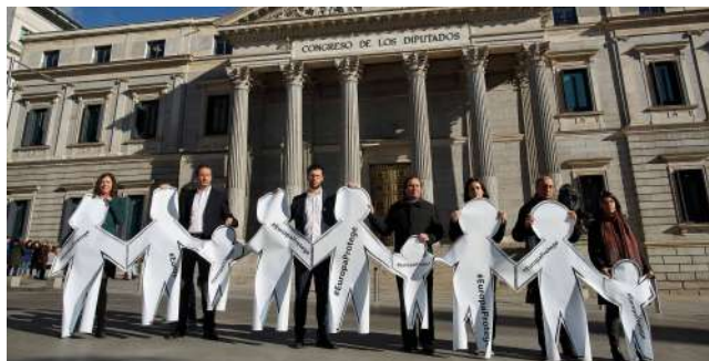
> Ayuda en Acción