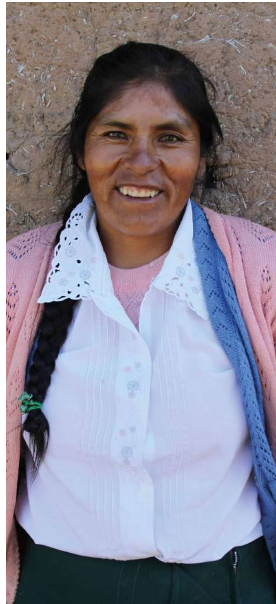
> Salva Campillo / Ayuda en Acción