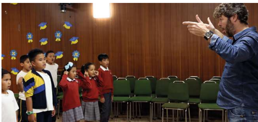
> Amaya Aznar / Ayuda en Acción

En el currículum vitae de Pablo Heras-Casado se acumulan las direcciones de algunas de las mejores filarmónicas del mundo y reconocimientos que le han convertido, con apenas 39 años, en uno de los directores de orquesta imprescindibles temporada tras temporada. Fuera del papel oficial queda la admiración de los entendidos en música clásica cuando le dan la enhorabuena al reconocerle súbitamente por la calle. O el respeto con el que, a escasos minutos de un ensayo, los músicos le llaman maestro. También su faceta más solidaria, la de embajador de Ayuda en Acción desde 2014 e impulsor de Acordes con Solidaridad. Tras una gira que le ha llevado de Nueva York a Salzburgo, nos abre las puertas de su casa para hablarnos de ese proyecto, mientras vela el sueño de Nicolás, su hijo de 9 meses, que duerme a escasos metros.