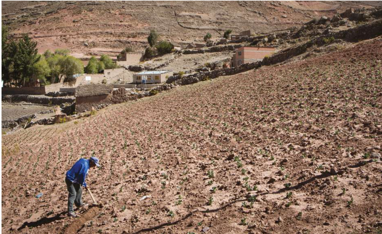
> Salva Campillo / Ayuda en Acción

los medios de vida de cientos de miles de personas.