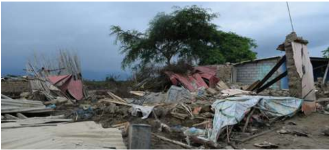
> Ayuda en Acción Perú

El agravamiento del fenómeno climático conocido como El Niño Costero fue el detonante de las lluvias que, el pasado mes de marzo, afectaron gravemente a la zona norte de Perú. A mediados del mes de abril, se contabilizaban 106 personas fallecidas y 155.000 damnificadas.