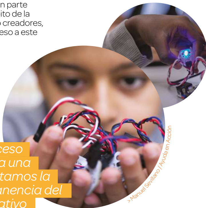
> Manuel Sevillano / Ayuda en Acción

Promovemos el derecho y acceso de la infancia y adolescencia a una educación de calidad. Fomentamos la mejora académica y la permanencia del alumnado en el sistema educativo