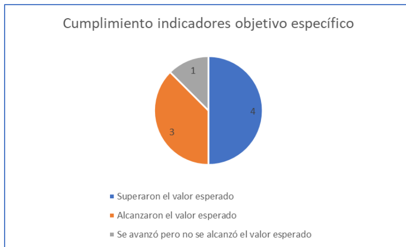
Gráfica 2 Cumplimiento indicadores objetivo específico

En la Gráfica 1 se puede ver que de 17 indicadores que tenía el proyecto con respecto a los 5 resultados esperados, 11 de ellos superaron los valores esperados, 5 consiguieron los valores y 1 no alcanzó lo esperado, aunque avanzó en esa dirección.