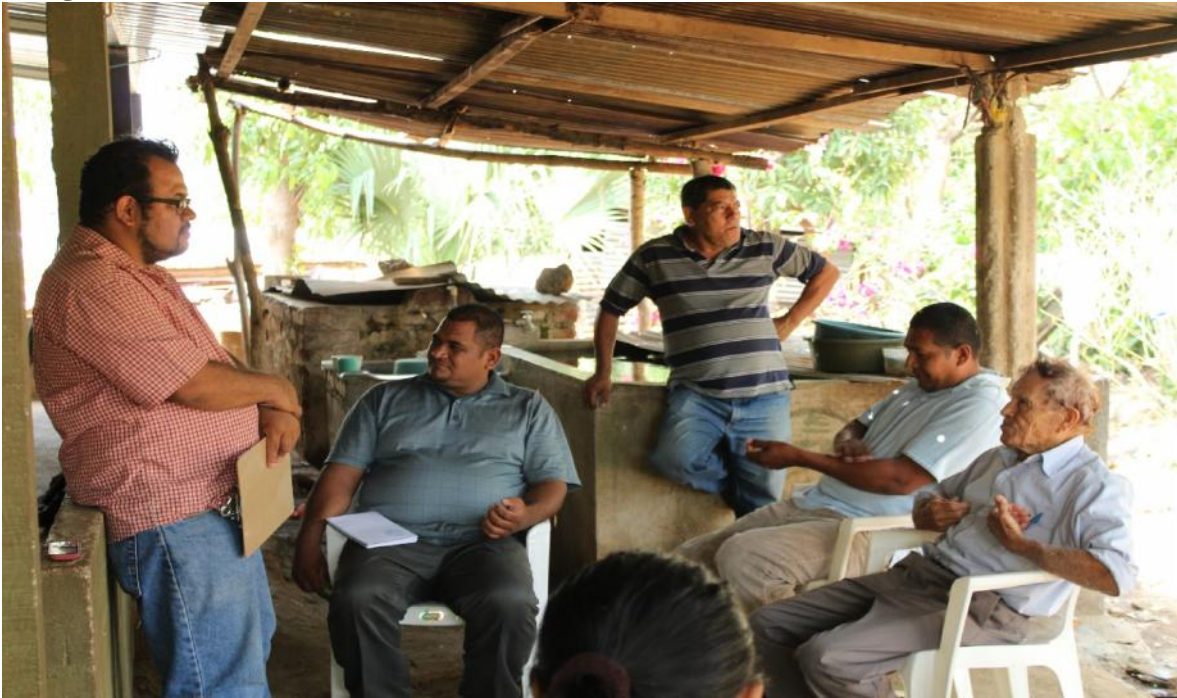
Reunión con líderes de la comunidad El Rodeo