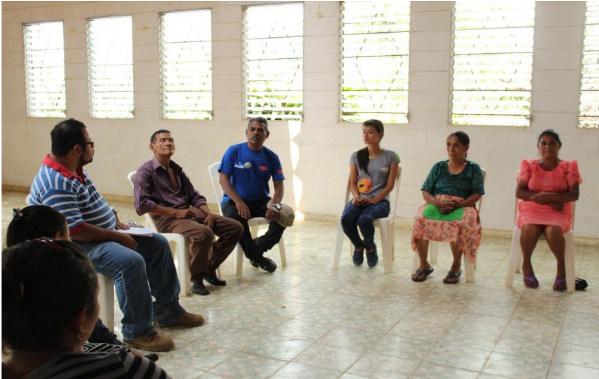
Reunión con líderes Comunidad El Rosario