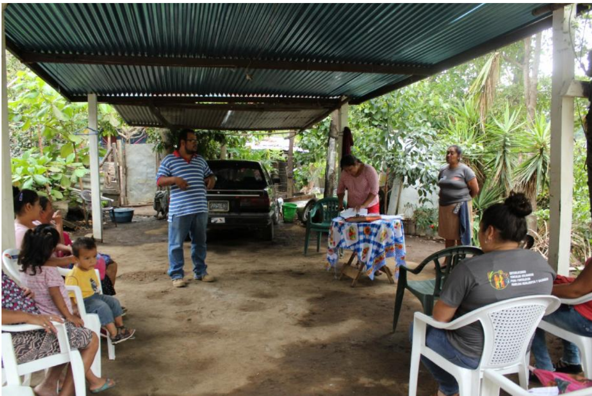
Reunión con líderes comunidad La Laguna.