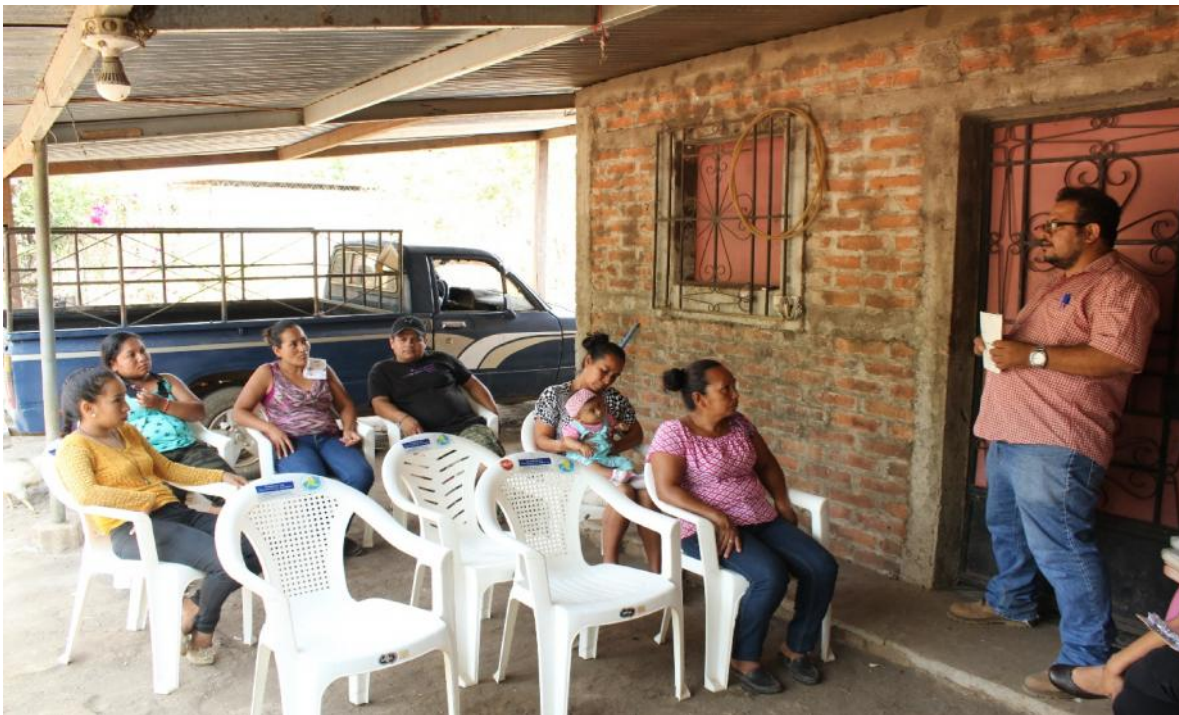
Reunión con líderes de la comunidad La Presa