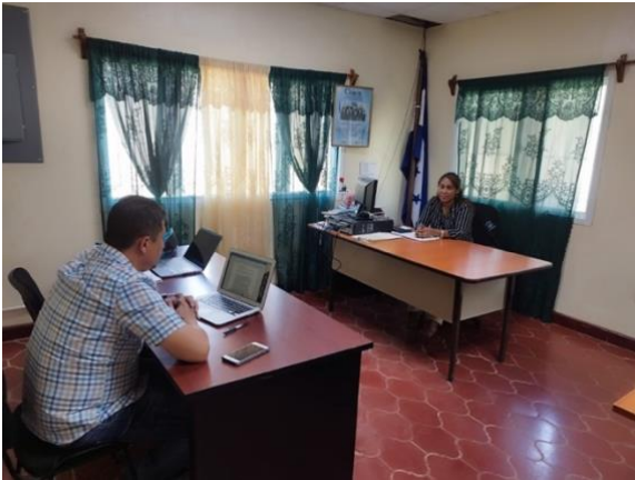
Entrevista Representante Juzgados de Paz