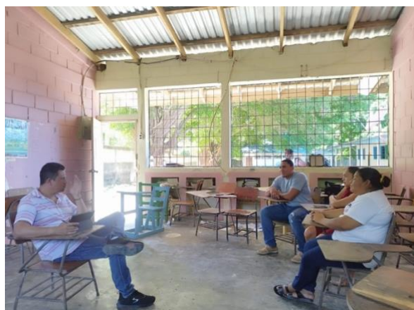
Grupo Consejo Comunitario Bambú