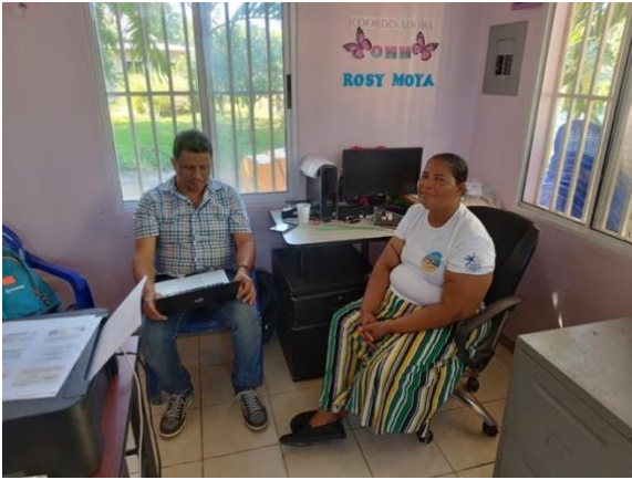
Entrevista OMM Balfate