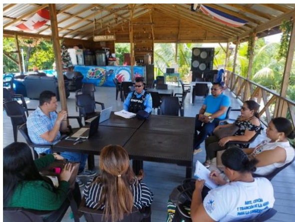
Grupo Focal Consejo Municipal Balfate