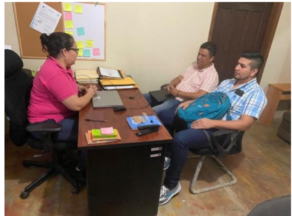
Entrevista MAMUGAH, Trujillo