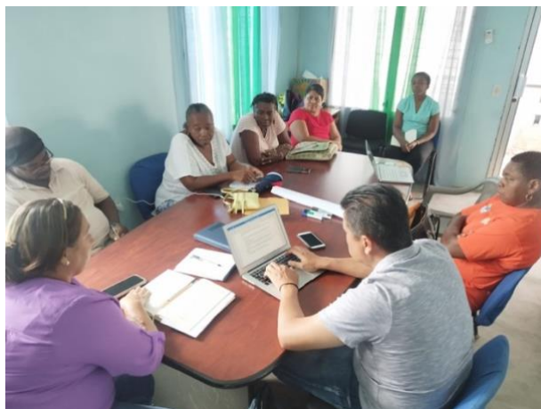
Grupo Focal Consejo Municipal Santa Fe.