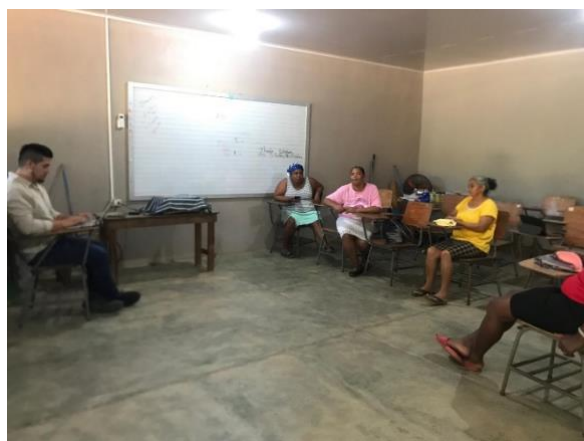
Grupo Focal Consejo Comunitario Col Margarita