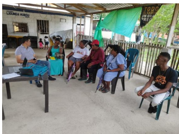
Grupo Consejo Comunitario San Antonio