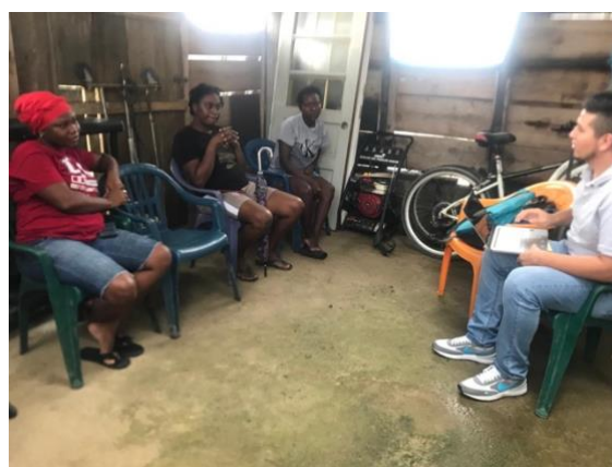
Grupo Consejo Comunitario Guadalupe