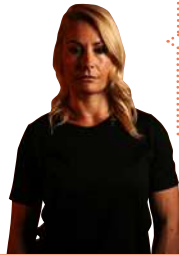
Lydia Valentín Halterófila

"Lidero esta campaña porque los récords climáticos nos afectan a todos y solo podremos frenarlos si actuamos como un equipo".