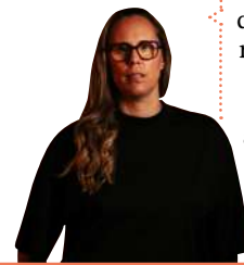
Amaya Valdemoro Jugadora de baloncesto

"Tenemos que parar los récords causados por el cambio climático".