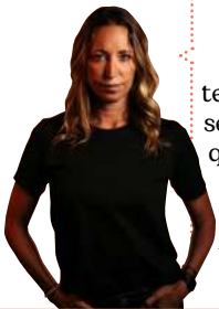
Gemma Mengual Nadadora

"El equipo de Ayuda en Acción se moviliza a diario para apoyar a las personas más vulnerables a los récords provocados por la crisis climática".