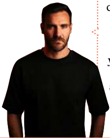
Saúl Craviotto Piragüista

Para que nuestra voz llegue más lejos nos hemos apoyado en algunas figuras públicas del deporte.